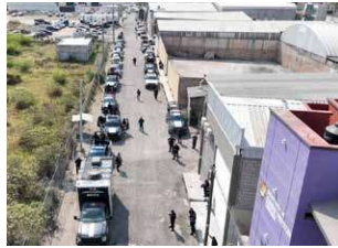
Se desplegarán un total de 802 elementos apoyados por 311 unidades entre patrullas y motopatullas.

Además, destacó que la corporación municipal brindará apoyo a los organismos electorales mediante monitoreo, atención y seguimiento a llamadas de emergencia, así como circuitos de seguridad en inmediaciones