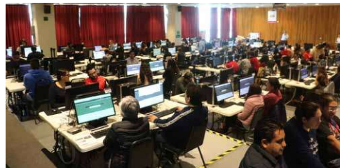
IEEM simuló ataques simultáneos en prueba del PREP para el día de la jornada electoral.

"Entonces realmente el PREP está listo para empezar a ofrecer los resultados a partir de las 20:00 horas con cortes cada 20 minutos y obviamente no lo tendrá, sólo habrá conteos rápidos para los cargos federales y para las gubernaturas. En el caso local es complicado porque pues a veces los municipios son muy pequeños y no alcanza una muestra estadísticamente significativa, entonces por esa razón no los estaremos realizando", finalizó.