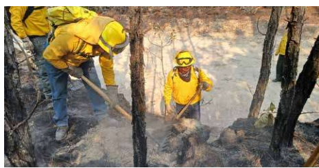
Más de 80 brigadistas de Probosque participan en los trabajos de atención al siniestro en San Mateo.