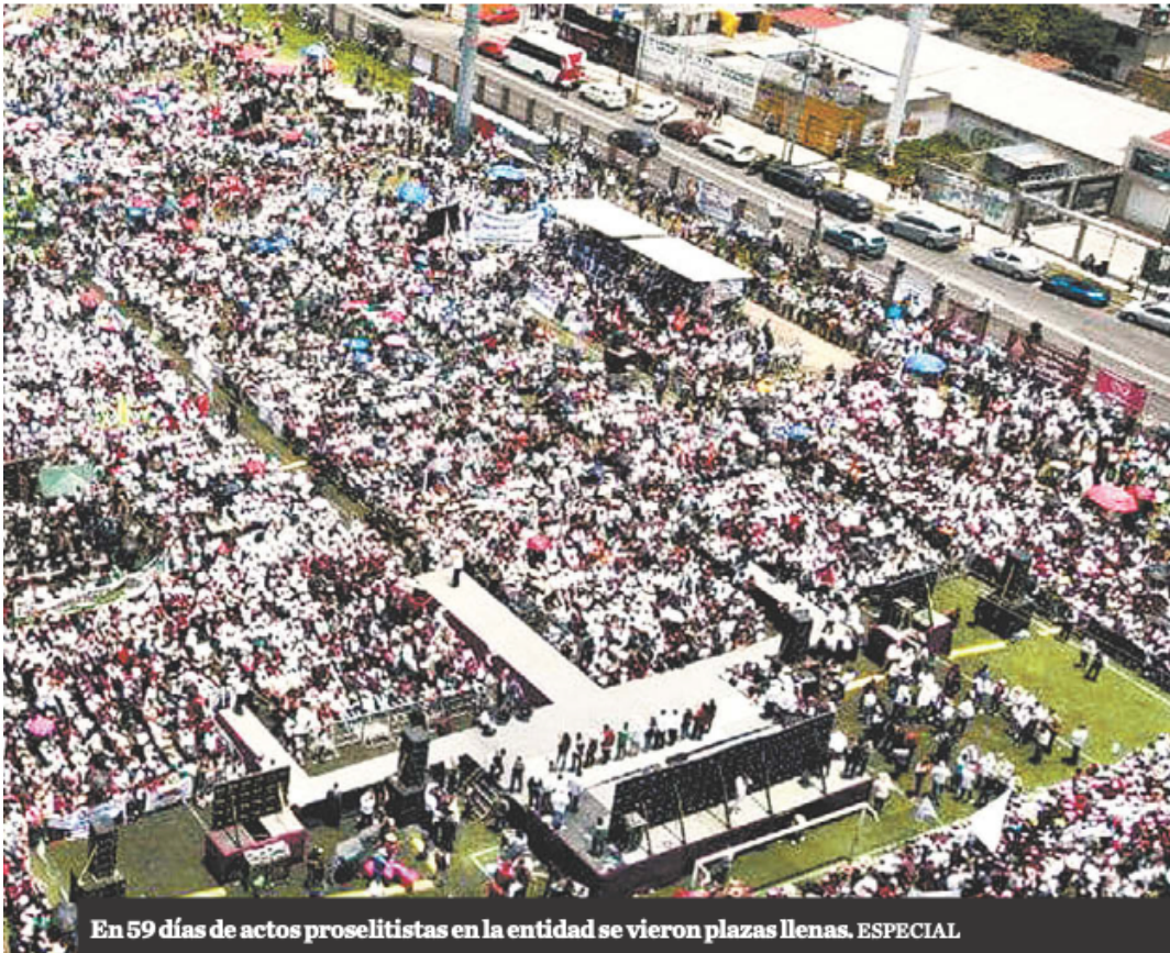
En 59 días de actos proselitistas en la entidad se vieron plazas llenas. ESPECIAL

otros 95.3 millones de pesos al pago de propaganda general y 67.4 millones a los anuncios colocados en la vía pública, como espectaculares o bardas pintadas. Solo en estos tres rubros quemó 90 por ciento de los recursos totales.