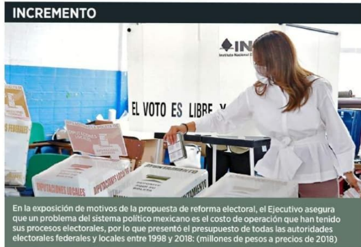
En la exposición de motivos de la propuesta de reforma electoral, el Ejecutivo asegura que un problema del sistema político mexicano es el costo de operación que han tenido sus procesos electorales, por lo que presentó el presupuesto de todas las autoridades electorales federales y locales entre 1998 y 2018: (millones de pesos a precios de 2018)

La visión del Ejecutivo federal es que se debe dotar al País de un sistema electoral que brinde seguridad y respeto al voto y honradez y legalidad, al advertir que esto no existe en la actualidad.