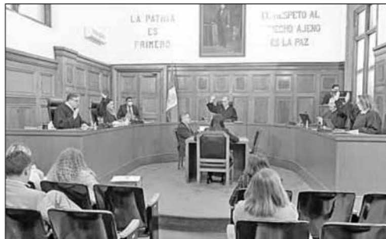
▲ Con el voto de los ministros Alberto Pérez Dayán y Luis María Aguilar, la segunda sala