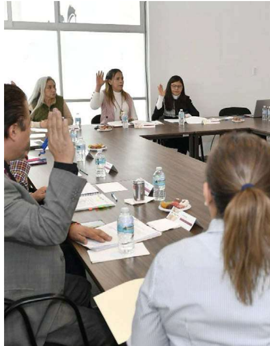
Primera sesión de trabajo de 2024. ESPECIAL

En esta sesión de trabajo, también se aprobó la revisión de la lista de espera, con el propósito de identificar a las personas solicitantes “que de forma voluntaria o por diversas circuns-